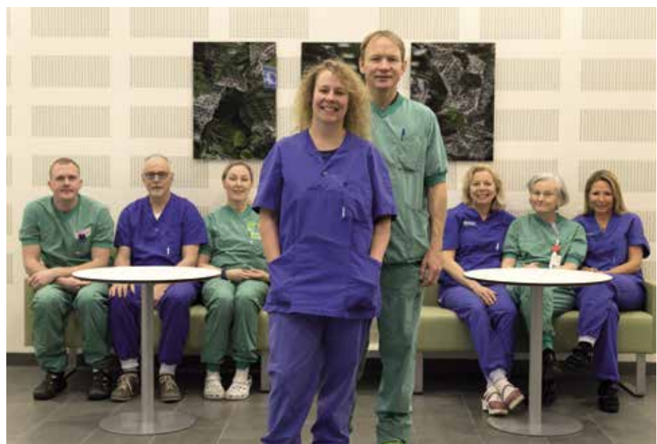
Delar av den lokala kommittén för SFAI i Karlstad.